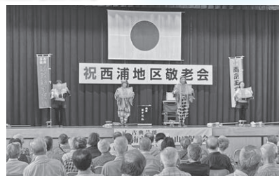
令和5年度敬老会の様子