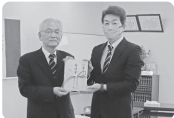
防府遊技場防犯組合 様

防府市仏教団 様 40,000円 防府地区モラロジー事務所 様 2,000円 ビューティーコロンビア 様 11,558円 匿名 名 5,000円 匿名 名 10,000円