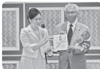
国際ソロプチミスト防府 様

匿名 名 3件 ※ 紙おむつ (ベビー用) 2袋 紙おむつ (大人用) 3袋 ※ 尿取りパッド 3袋