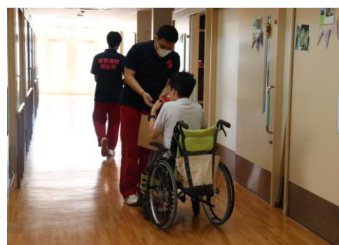
▲施設での体験の様子