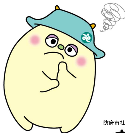
防府市社協思いやり大使

※詳しくはひとり親受験生応援プロジェクト実施要綱を必ずご確認ください。 よくある質問はホームページをご覧ください。