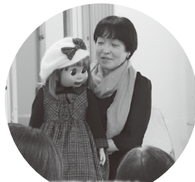
腹話術人形(希ちゃん)と

佐波地区の5つの自治会が、合同で開催しているサロン。毎月1回開催され、1周年を迎えられました。