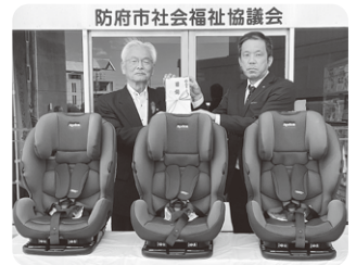
防府商工会議所 様