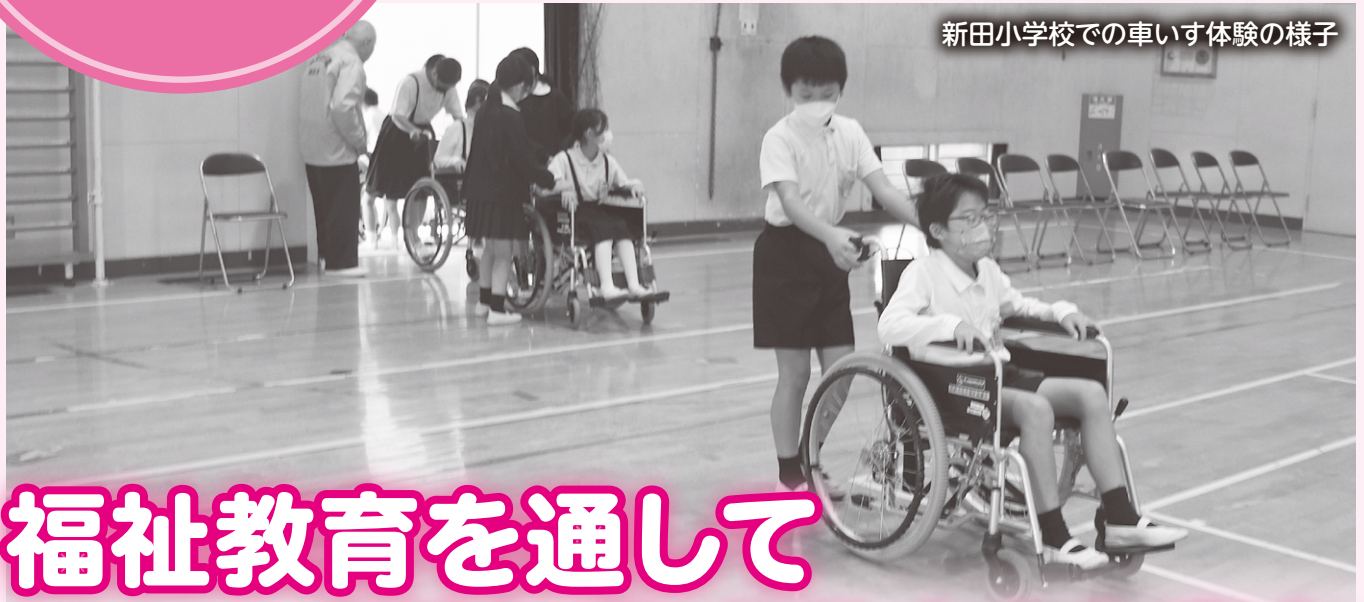
新田小学校での車いす体験の様子