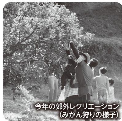
今年の郊外レクリエーション (みかん狩りの様子)

また、障がい者・児とその家族がふれあい、励まし合いながら友達との交流を深める郊外レクリエーションを開催しています。