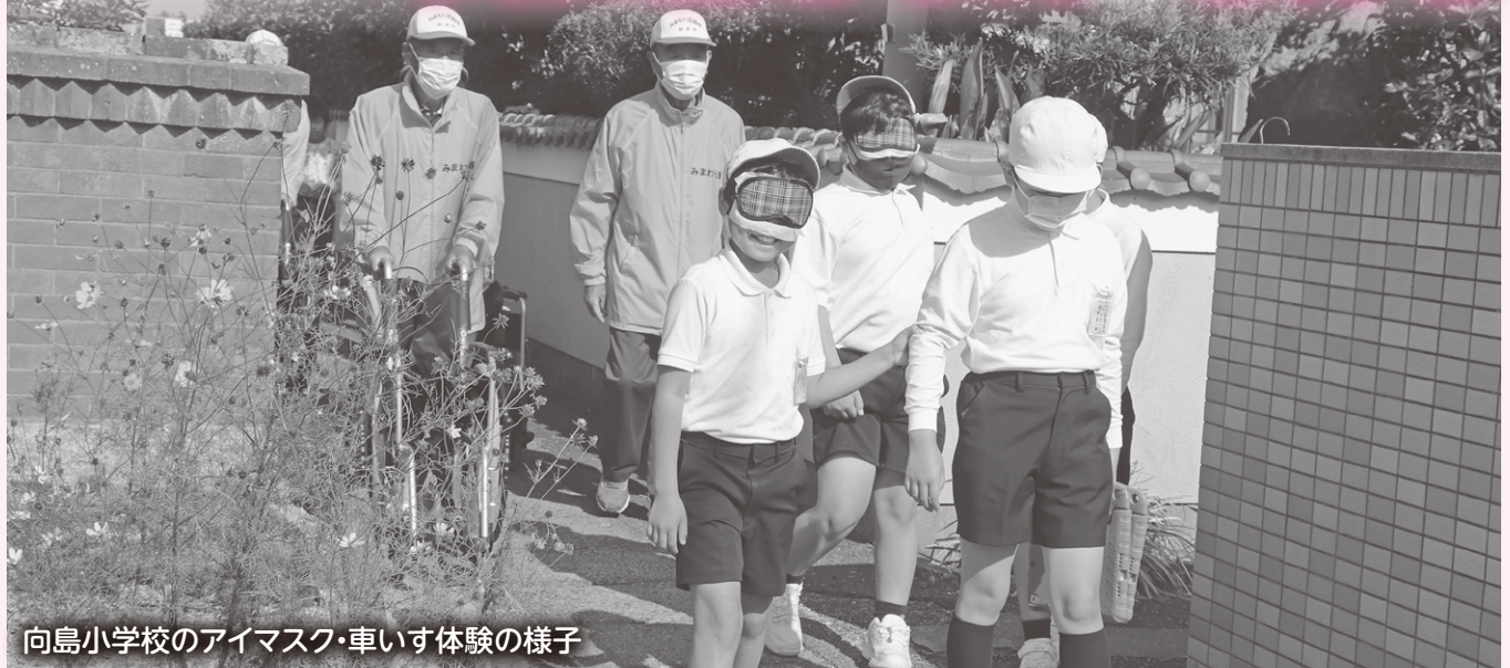
向島小学校のアイマスク・車いす体験の様子

防府市社会福祉協議会は、福祉教育を通して『相互に助け合う（我が事）』や『地域のつながり』の大切さを実感できるよう、福祉の輪づくりのお手伝いをしています。