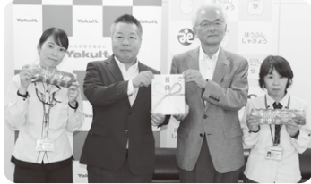
(株)ヤクルト山陽 様