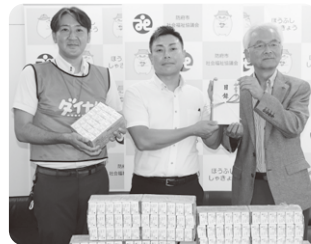
ダイナム山口防府店 様