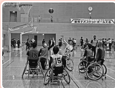
車いすバスケットボール大会