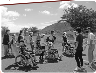
夏休み親子福祉体験