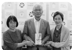
表流 防和会 様