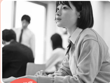
令和5年度 新規事業 ひとり親受験生応援