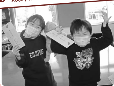
施設入所児へのお年玉