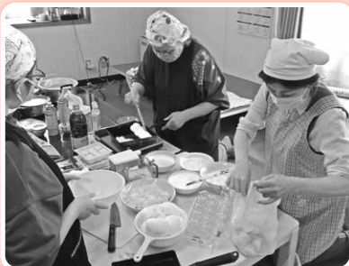
子ども食堂(地域食堂)