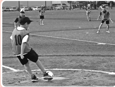
キックベースボール大会