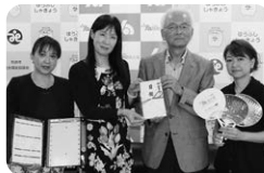
防府法人会女性部会 様