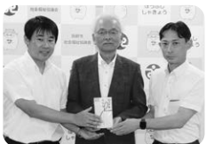
ブリヂストン労働組合 下関支部防府分会 様