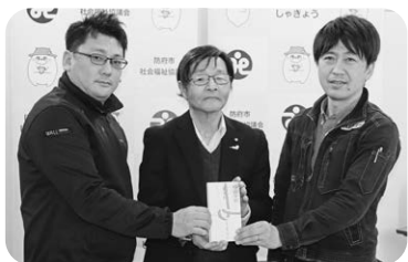
株式会社銘建 銘工会 様