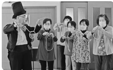
🎩 手品体験 🎩