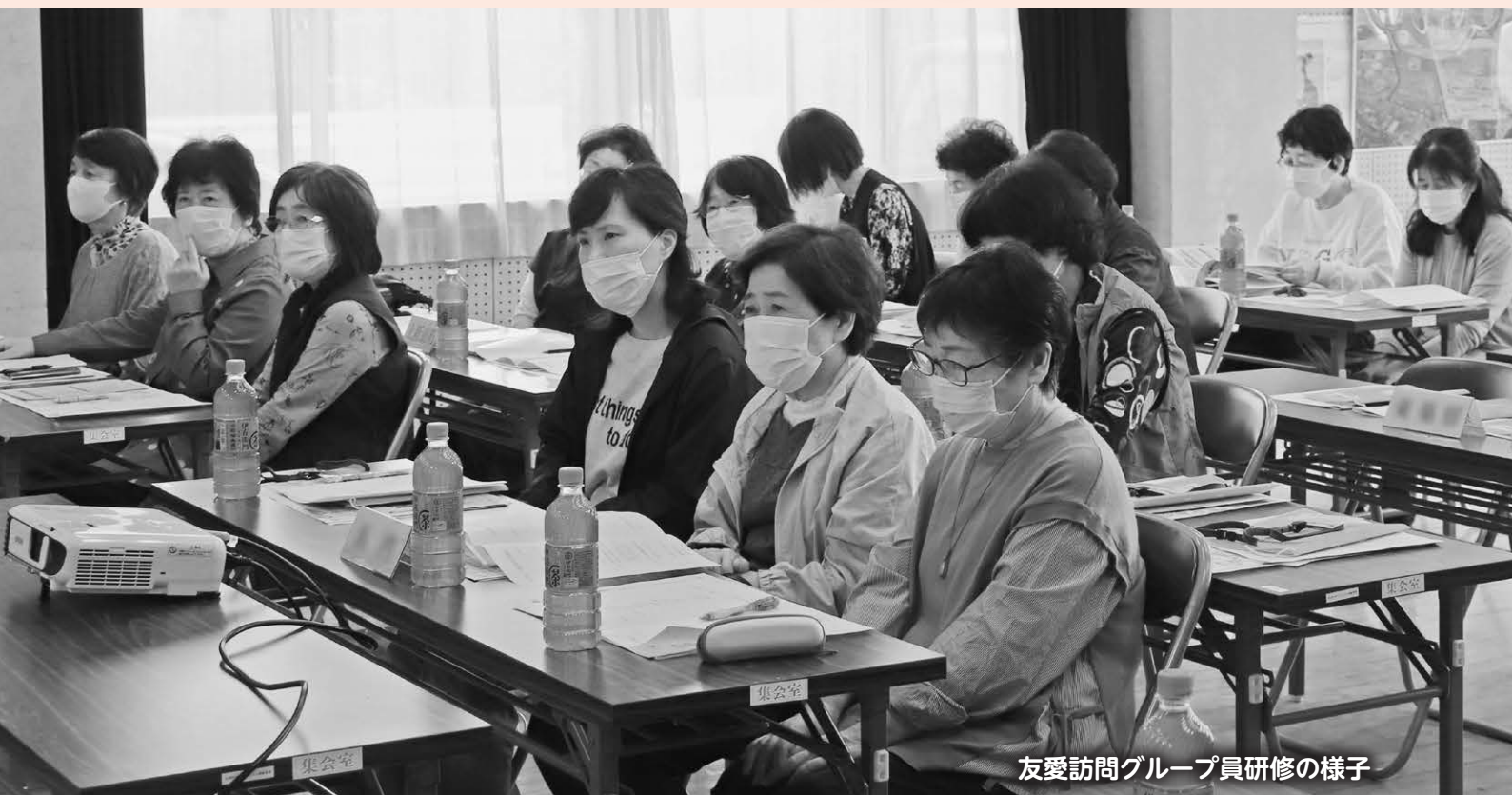
友愛訪問グループ員研修の様子

本年4月、福祉員（約300人）及び友愛訪問グループ員（約700人）の改選があり、現在、各地区で委嘱状が交付されています。