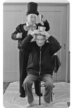
🎩 水の芸 🎩

長年の功績を糧に、ボランティア活動で更に花を咲かせる。防府には、こんなステキな活躍の場“サロン”がありました。