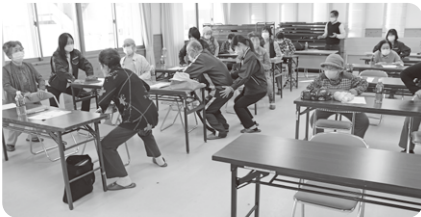
☆ ストレッチ ☆

開催できたのは、みなさんのおかげです。 みなさんの喜ぶ姿、想像以上の反響があって嬉しかった！ やって良かったです😊