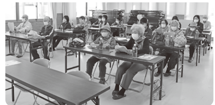
♪ Singing ♪