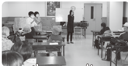
👉 じゃんけん大会 👉